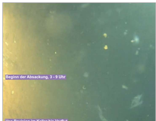
Beginn des Unterbogens – unter Wasser